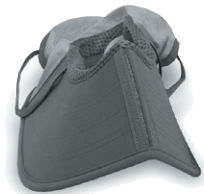
クラムシェルブリムで大きなツバもコンパクトに折り畳めます