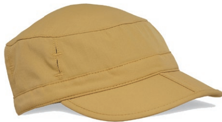
ゴールデンロッド (638)

サングラスロックとクラムシェルブリム付きで、便利な機能が満載なキャップです。シンプルでかぶりやすいデザインは、ベストセラーモデルの1つです。