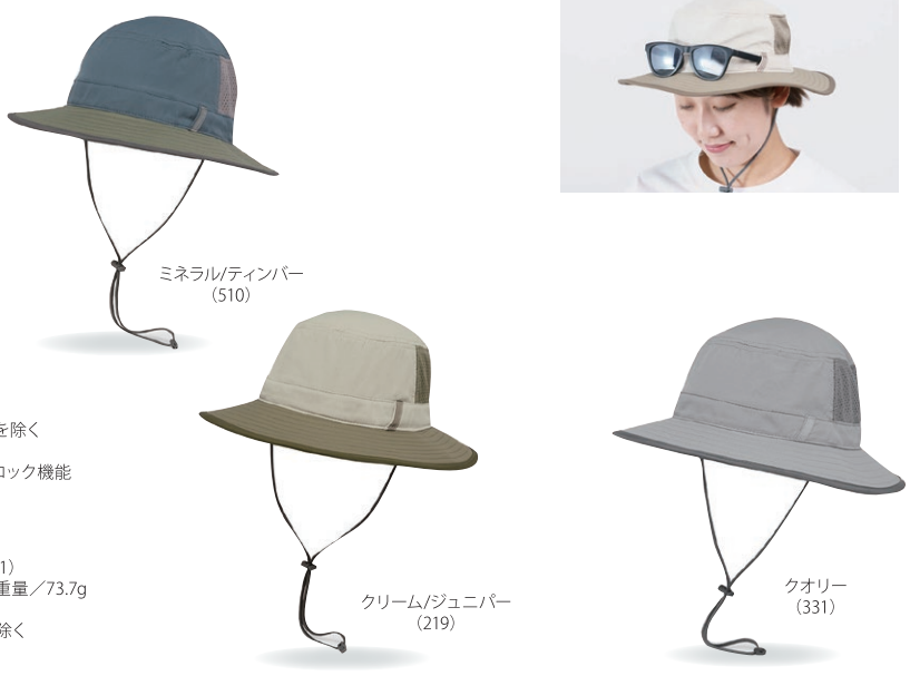
ミネラルティンバー (510) クリーム/ジュニバー (219) クオリー (331)

カラー/クリーム/ジュニバー (219)、ミネラルティンバー (510)、クオリー (331) サイズ/S/M:54~58cm、L/XL:58~62.5cm 重量/73.7g 素材/本体:100%ナイロン メッシュ:100%ポリエステル 装飾部を除く 生産国/ベトナム製