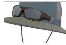
サングラスロックを装備