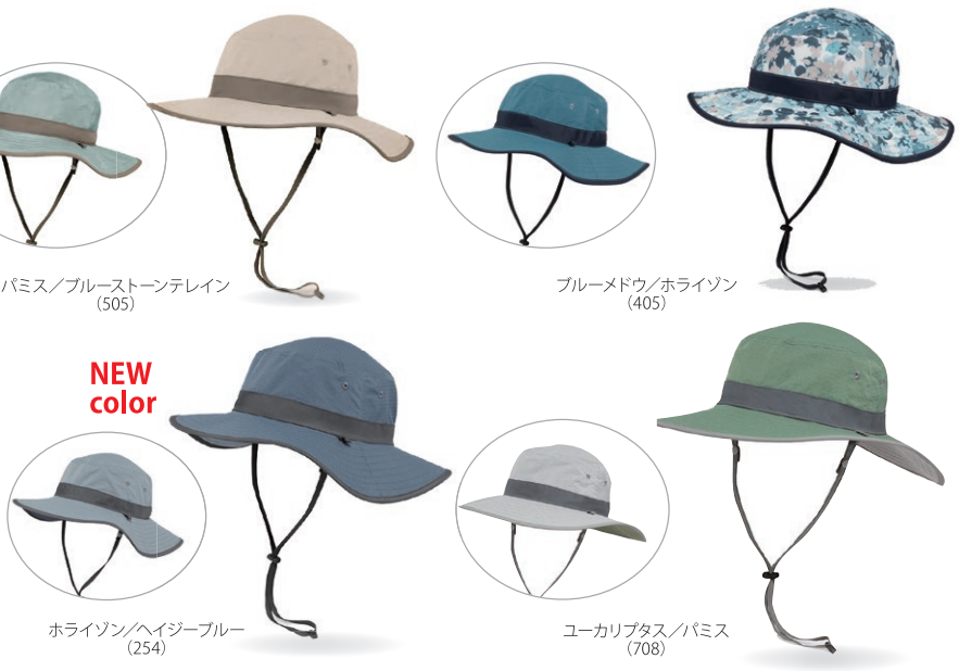
ムーンストーン/パミス (197) パミス/ブルーストーンテレン (505) ブルーメドウ/ホライゾン (405) ホライゾン/ヘイジーブルー (254) ユーカリプタス/パミス (708)

カラー/ムーンストーン/パミス (197)、パミス/ブルーストーンテレン (505)、ブルーメドウ/ホライゾン (405)、ユーカリプタス/パミス (708)、ホライゾン/ヘイジーブルー (254) サイズ/M(ワンサイズ):56~58cm 重量/87.9g 素材/本体:100%ポリエステル 裏面:88%ナイロン 12%ポリエステル 装飾部を除く 生産国/ベトナム製