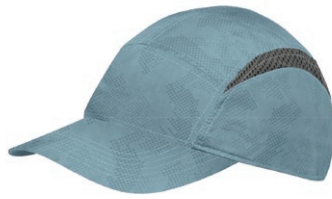
ブルーストーンテレン