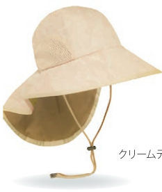
クリームグリーン