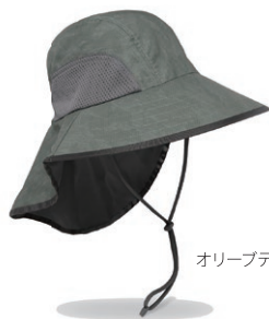
オリーブグリーン