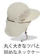
丸く大きなツバと短めなネックケープ