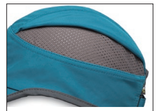
開閉可能なベンチレーション

サングラスロックとクラムシェルブリム付きで、便利な機能が満載なキャップです。シンプルでかぶりやすいデザインは、ベストセラーモデルの1つです。