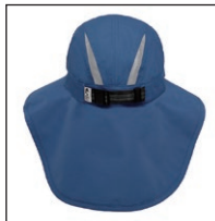
後頭部には反射リフレクター