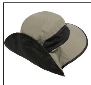
後頭部のマジックテープを使ってケープを上げ下げできます