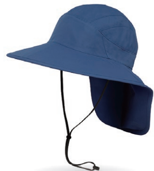
クレーターブルー