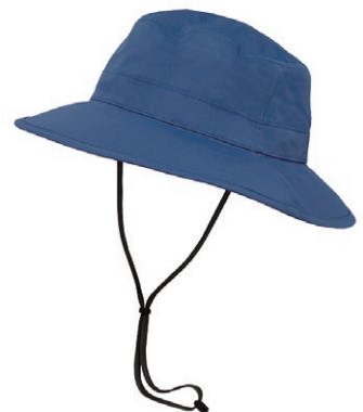
クレーターブルー