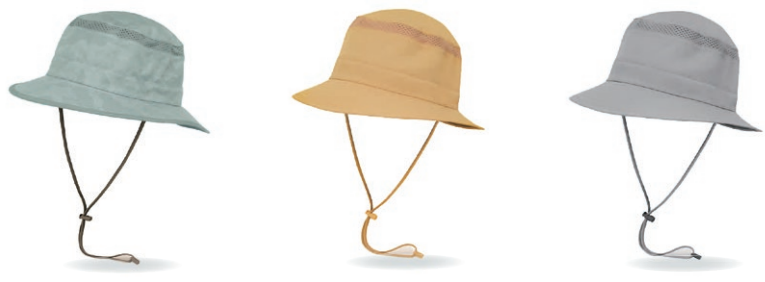
ブルーストーンテレン ブラウンライス クオリー

カラー/ブルーストーンテレン、ブラウンライス、クオリー サイズ/M:56~58cm、L:58~60.5cm 重量/71g 素材/本体:100%ナイロン メッシュ:100%ポリエステル つばの裏面:100%ポリエステル 生産国/ベトナム製