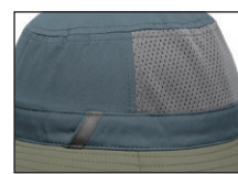
後頭部はメッシュ仕様

2通りのカラーが楽しめるリバーシブルタイプ。その日の気分やウェアに合わせてかぶれます。 クラッシュパルなので持ち運びにも便利。