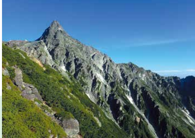
Mt. Yarigatake, Nagano, Japan

「マウンテンシップデザイン」 日本人が使いやすいようにこだわった、ケンコー社の オリジナルブランドです。