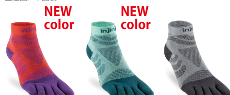
ラズマタズ RAZ グレイシャー GLC スレート SLA