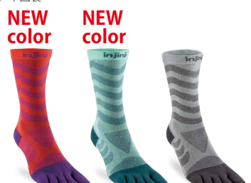
ラズマタズ RAZ グレイシャー GLC スレート SLA