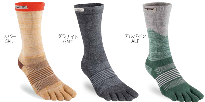
スパー SPU グラナイト GNT アルパイン ALP