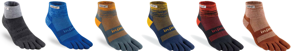
グラナイト GR マリーナ MRN ウェイブ WAV ムーンリット MLT メテオ MET パーク BAR

213170 トレイルミッドウェイトクルー ¥2,200 (税抜価格: ¥2,000)