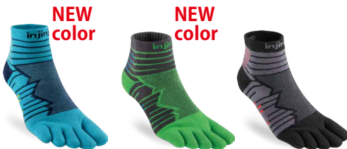
パシフィックブルー PAC エメラルド EME オニキス ONY