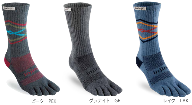
ピーク PEK グラナイト GR レイク LAK