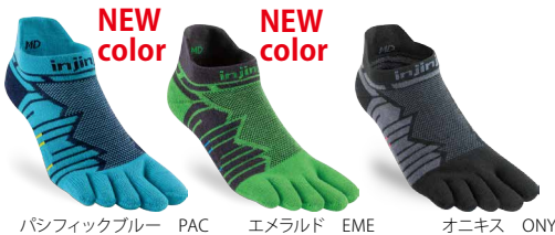
パシフィックブルー PAC エメラルド EME オニキス ONY