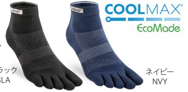
ブラック BLA ネイビー NVY