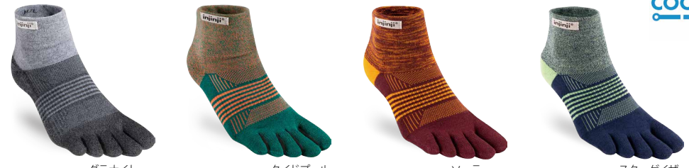
グラナイト GNT タイドプール TID ソーラー SOL スターゲイザー STZ