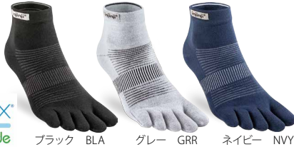
ブラック BLA グレー GRR ネイビー NVY