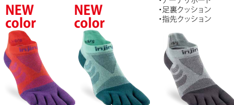
ラズマタズ RAZ グレイシャー GLC スレート SLA